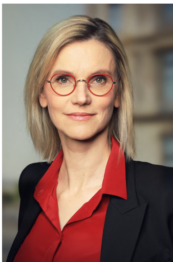
Agnès Pannier-Runacher, ministre de la Transition énergétique